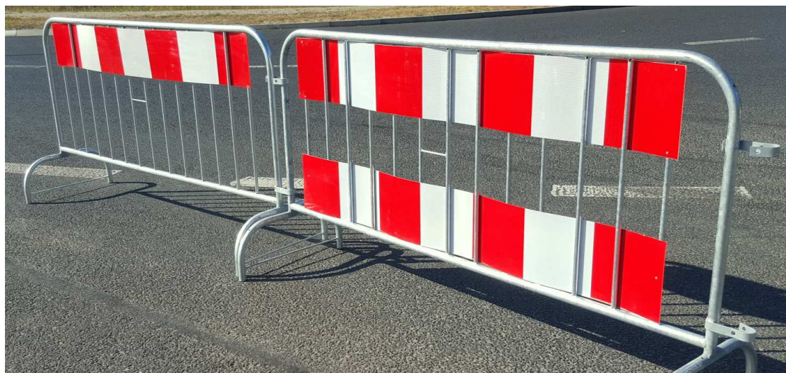
Połączone ze sobą barierki lekkie