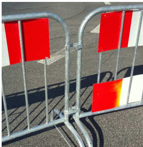
Łączenie barierek lekkich

Ponadto barierki mogą być wyposażone w blachy odpowiadające znakom U-20 a, b lub c wykonanymi z folii II typu. Dzięki temu są bardzo dobrze widoczne dla kierujących pojazdami oraz pieszych.