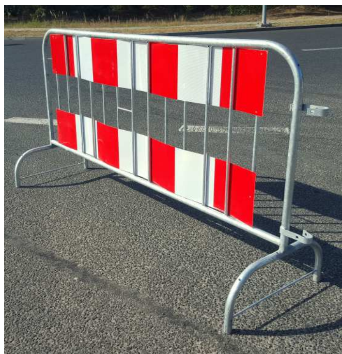
Barierka z tablicami U-20c

Wynajem barierek wygradzających oraz oznakowania drogowego na czas trwania wydarzeń kulturalnych, imprez masowych oraz zawodów sportowych